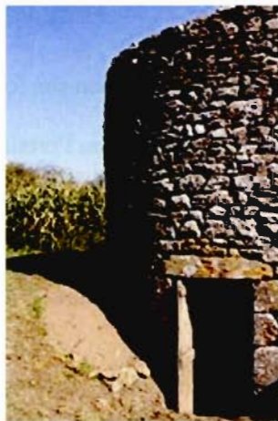
FOUR A CHANVRE AU PLESSIS