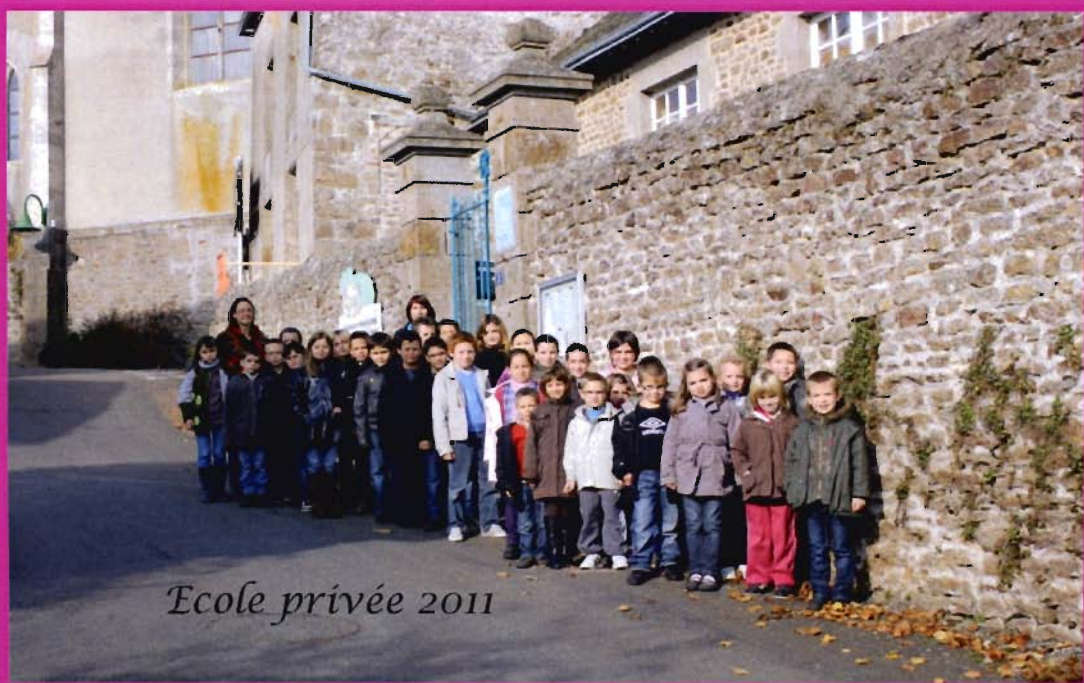
Ecole privée 2011