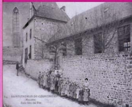
Ecole libre des filles 1930