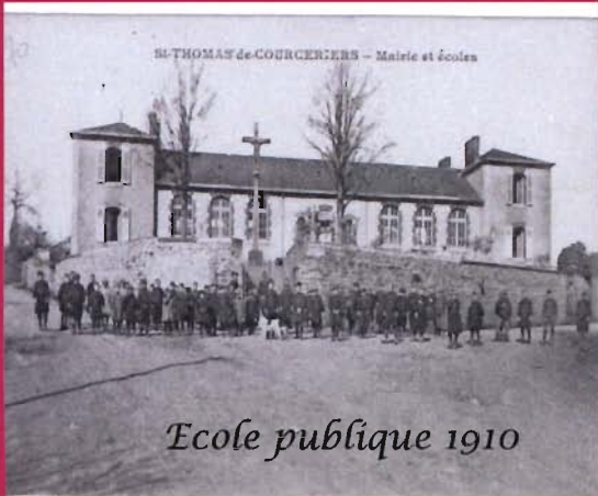
Ecole publique 1910