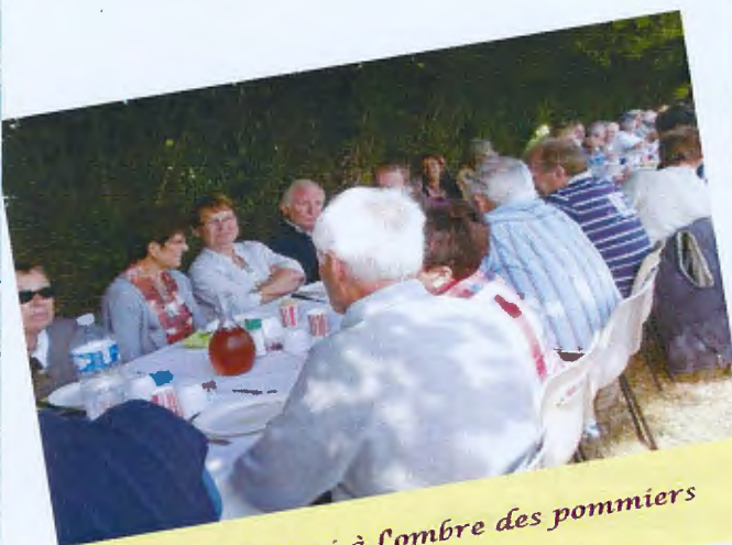
Un méchoui à l'ombre des pommiers

En 2012, le loto a rempli la salle des fêtes comme à son habitude. L'entrecôte, elle, a vu son nombre de participants diminuer mais l'ambiance n'en a pas été moins festive pour autant. La journée pêche du 14 juillet a dû être annulée en raison de l'état du champ communal et des berges après des semaines de pluie, mais nous avons eu le plaisir de passer le dimanche 26 août à l'ombre des pommiers pour un méchoui bien ensoleillé. Tout l'été, vous avez également pu découvrir les épouvantails, animation organisée avec l'Association Ensemble pour l'Environnement et le Patrimoine à Saint Thomas. Vous pouvez d'ores et déjà réfléchir à un nouvel épouvantail sous le thème du chapeau pour l'été 2013.