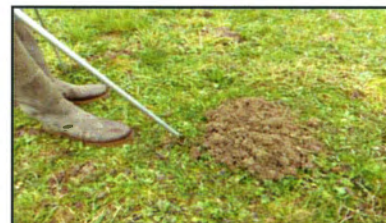
Dépôt de pastilles de PH3 dans les taupinières et les galeries empruntées par les taupes à l'aide d'une canne spécifique

De par son statut réglementé d'Organisme Nuisible (arrêté ministériel du 31/07/2000), des luttes collectives au printemps et à l'automne peuvent se mettre en place à l'aide d'un arrêté municipal et d'une organisation de la FDGDON de la Mayenne : inscription en mars et en septembre.