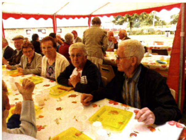
Un repas champêtre convivial et ensoleillé

L'évènement majeur de l'année 2015 fût la soirée cabaret du 14 novembre.