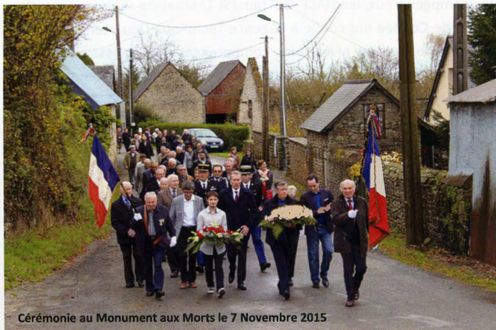
Cérémonie au Monument aux Morts le 7 Novembre 2015

Les autres manifestations restent à définir.