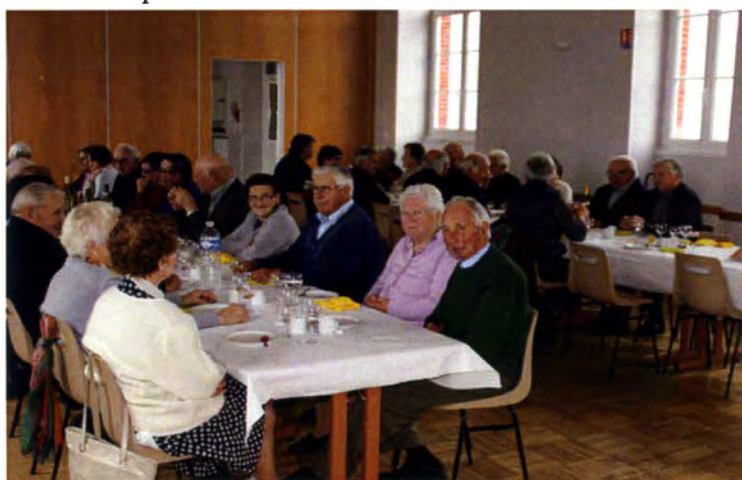
repas du club du 21.10.2015

Tous les 3 ème mercredis de chaque mois, nous fêtons les anniversaires.