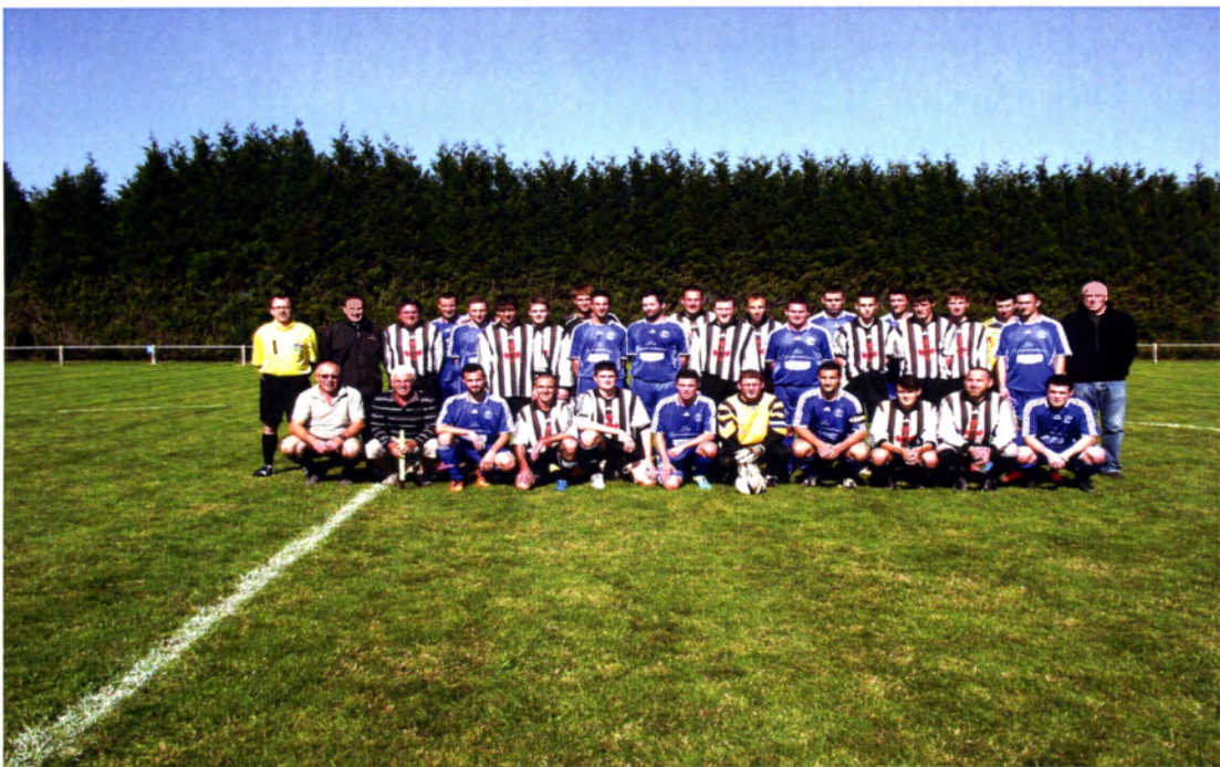
Coupe de Maine Vaudelle 4 e div contre Gorrion DRH