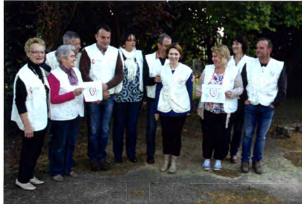
Une partie des membres de l'association

Alors n'hésitez plus, rejoignez-nous !!!