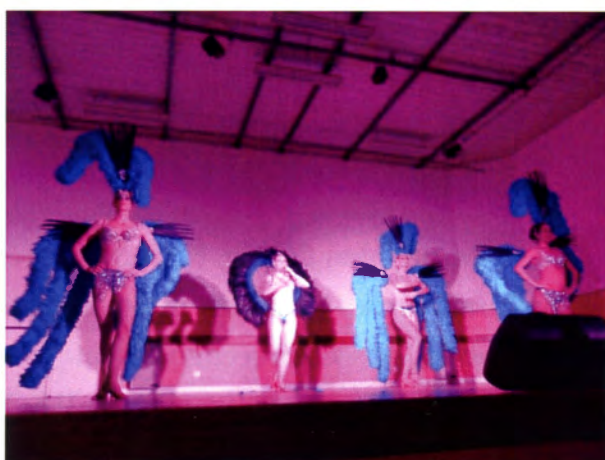
Une troupe d'artistes de cabaret magnifique

Près de 250 personnes y ont pris plaisir à partager un menu de fête et à admirer les artistes venus offrir un spectacle haut en couleurs, pétillant et drôle.