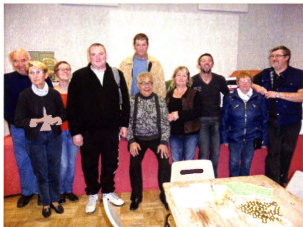
Quelques gagnants du Loto et membres du comité

Le loto, malgré une participation un peu faible, a offert ses plus beaux lots à des habitants de la commune ou des alentours, pour notre plus grande satisfaction.