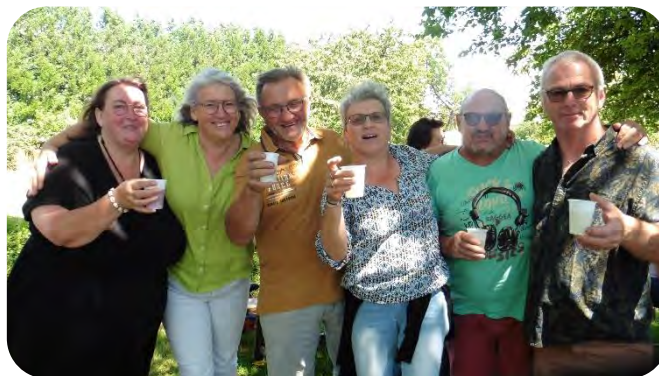
14 juillet la bonne humeur et le soleil étaient au rendez-vous