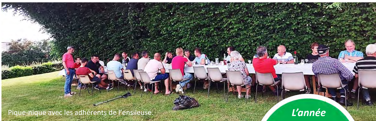
Pique-nique avec les adhérents de l'ensileuse

Cette association est un lien social et amical entre agriculteurs.