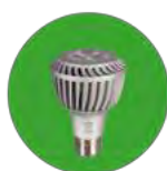
Ampoule à led