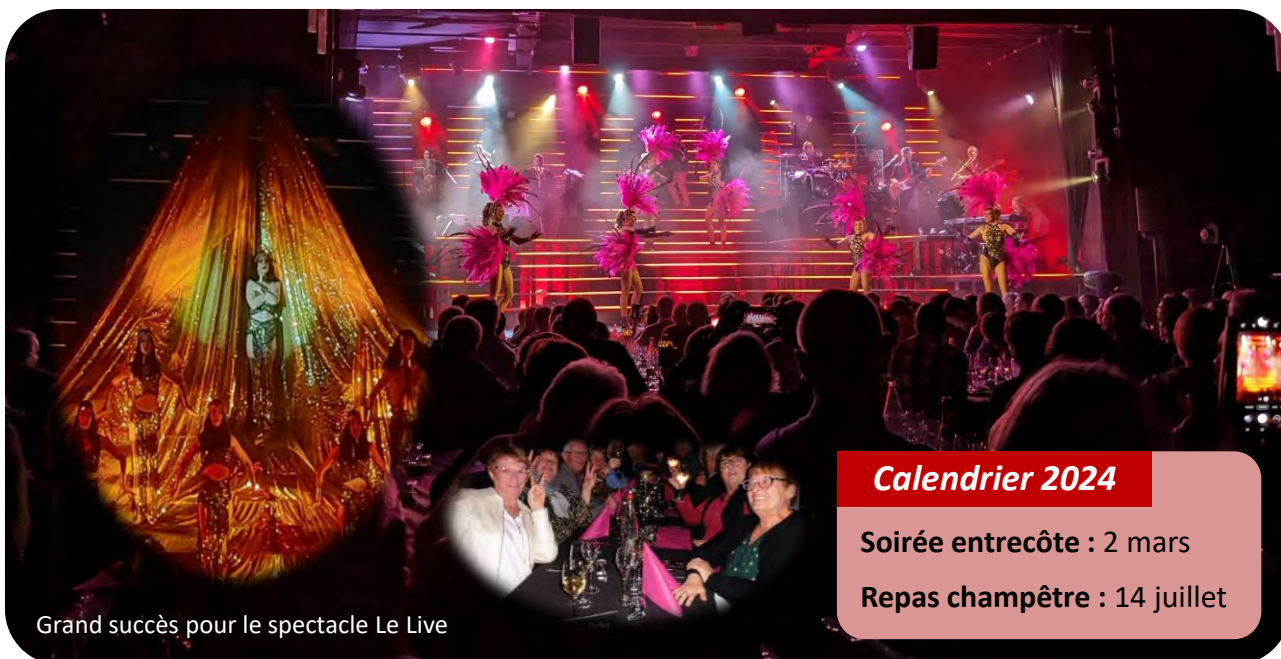
Grand succès pour le spectacle Le Live