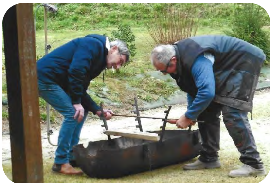
Préparation du barbecue pour la soirée entrecôte