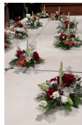
Art floral : décoration de table réalisée pour Noël

Nous remercions les municipalités pour leur aide financière et leur prêt de salle. Nous comptons sur toutes les personnes intéressées.